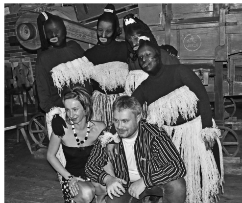
foto z plesu