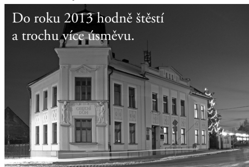
Do roku 2013 hodně štěstí a trochu více úsměvu.